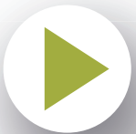
MUZIEK EN TV