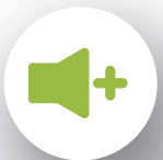
VEILIGHEID, GEZONDHEID EN SIGNALERING